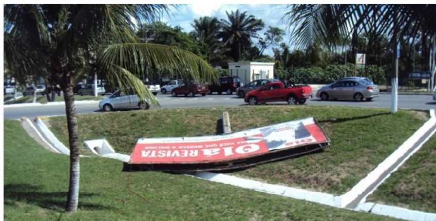
Figura 41– Remoção de Outdoor em área pública