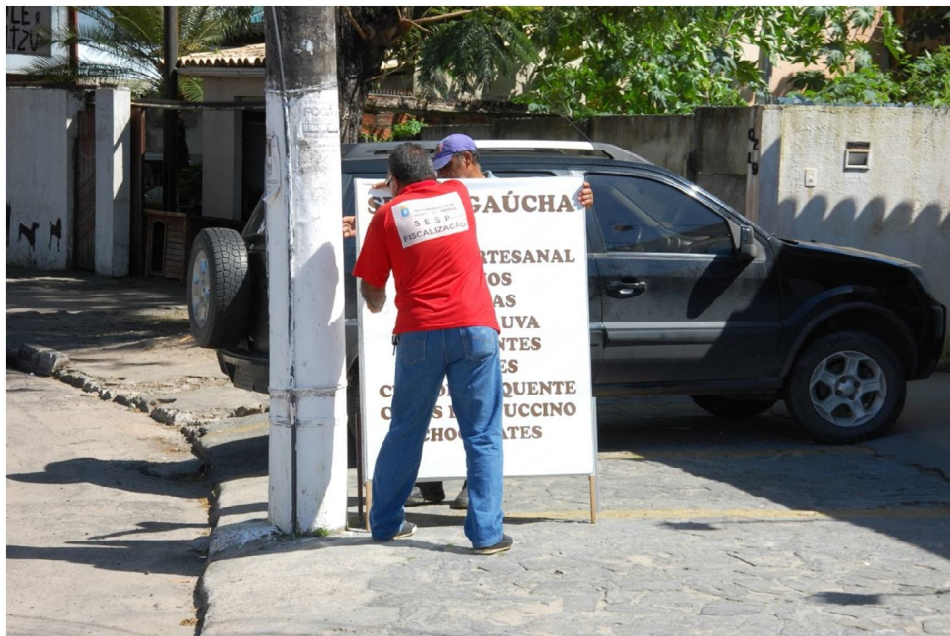
Figura 39 - Operação Calçadas

Com 3 edições realizadas nos loteamentos Miragem e Vilas do Atlântico, a operação já contabilizou mais de 30 engenhos removidos, entre placas e cavaletes, e foram emitidas mais de 50 notificações determinando que os responsáveis por imóveis que obstruem os passeios realizem a remoção dos objetos.