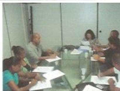
Data: 02/04/2013 Local: SEPLAN