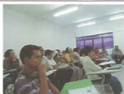
Data: 24/05/2013 Local: UNIME