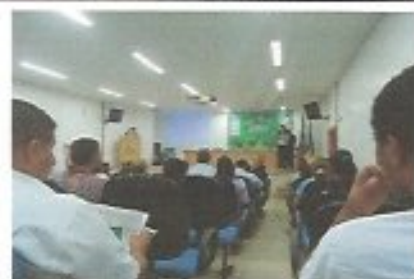
Data: 23/05/2013 Local: UNIME