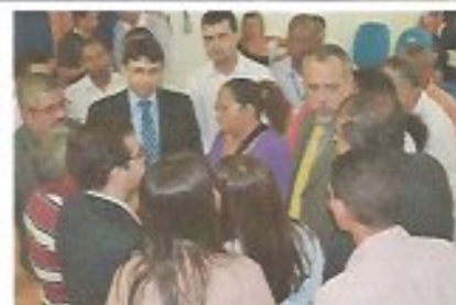
Data: 24/05/2013 Local: UNIME