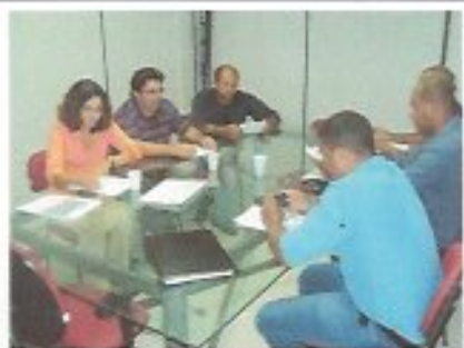
Data: 22/03/2013 Local: SEPLAN