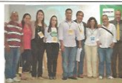
Data: 24/05/2013 Local: UNIME