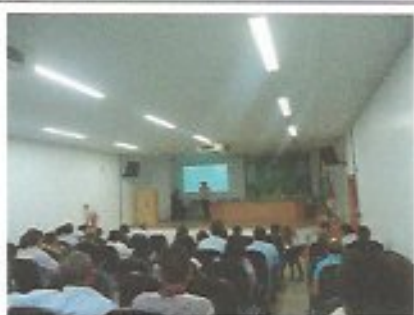
Data: 23/05/2013 Local: UNIME