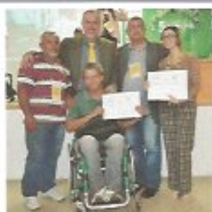
Data: 24/05/2013 Local: UNIME