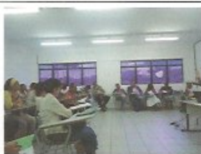
Data: 24/05/2013 Local: UNIME