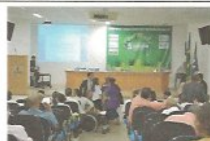
Data: 24/05/2013 Local: UNIME