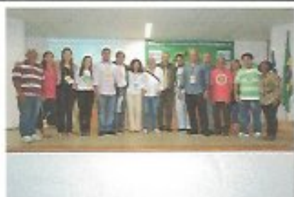
Data: 24/05/2013 Local: UNIME